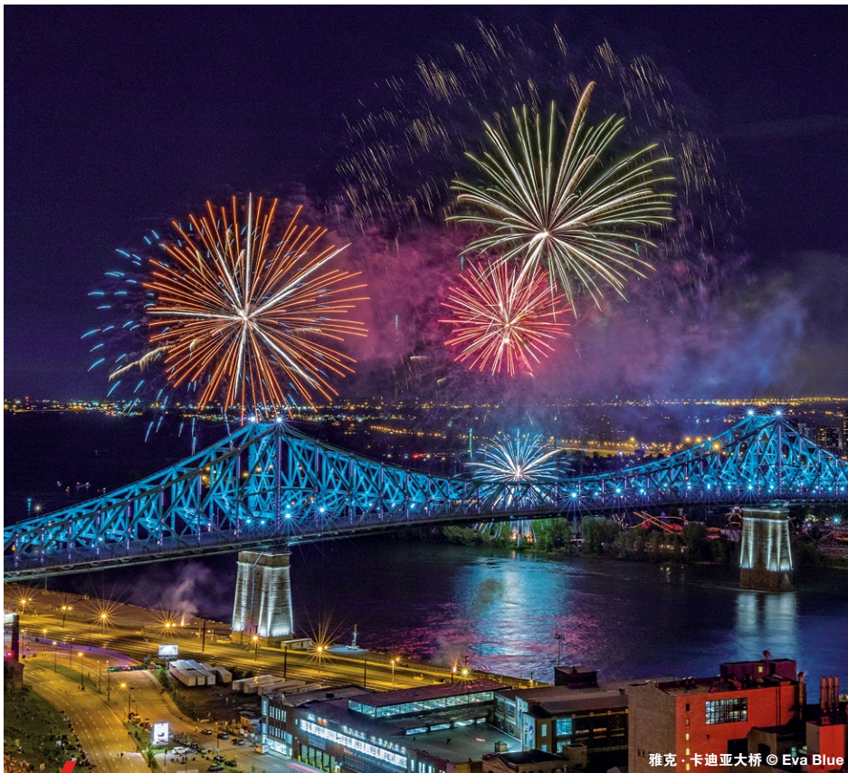
雅克·卡迪亚大桥 © Eva Blue