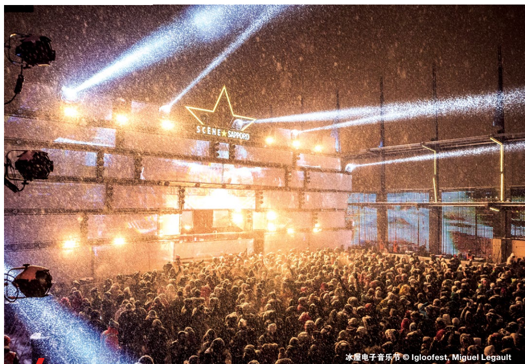
冰屋电子音乐节

蒙特利尔的秋天有着令人惊叹的斑斓色彩、数不胜数的活动和各种大型展览，为仰慕者留下难忘的回忆和珍贵的照片。但惊喜才刚刚开始！冬季，蒙特利尔人精力十足、热情昂扬地开始了各项户外活动。滑雪、雪鞋漫步、滑行、冰吧消遣、建冰屋比赛等，精彩的冬季活动远不止这些，快来蒙特利尔感受冬季的独特魅力！