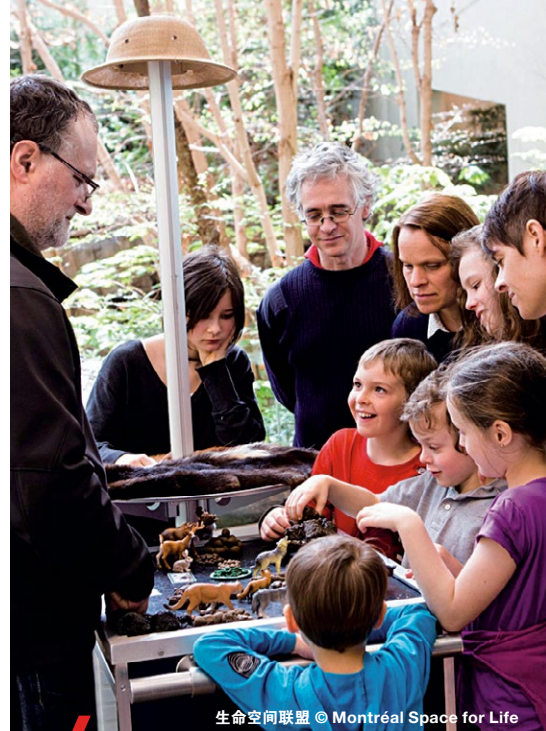
生命空间联盟