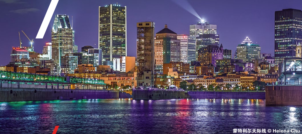
蒙特利尔天际线