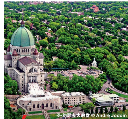
圣·约瑟夫大教堂 © André Jodoin

晚上： 穿过光彩跃动的 雅克·卡迪亚大桥(Jacques Cartier Bridge) 后，游览让·德普公园(Parc Jean-Drapeau)中灯火通明的 生物圈 ， 环保博物馆(Biosphère, Environment Museum) ，这里也是1967年世博会的举办场所。在 蒙特利尔娱乐城(Montréal Entertainment Complex) 享用5星级晚餐并观看表演。