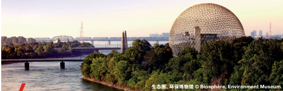
生态圈, 环保博物馆